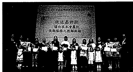
於聯校教育日向長期服務的老師致謝

袁天佑表示，校本管理的精神，是讓不同持分者都能參與校政，現時辦學團體內的校董會已有老師和家長代表，已經體現了校本管理的精神，毋須跟從政府建議，將校