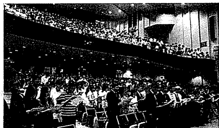
聯校教育日教師研討會

循道衛理會至今共有10間小學、8間中學和13間幼稚園/幼兒園。袁天佑表示，教會早期的學校多建於石硤尾、橫頭坳、觀塘等新區內，隨著社區變遷，部分已經結校。然而，有些學校卻越辦越好，取錄了較高質素的學生，但教