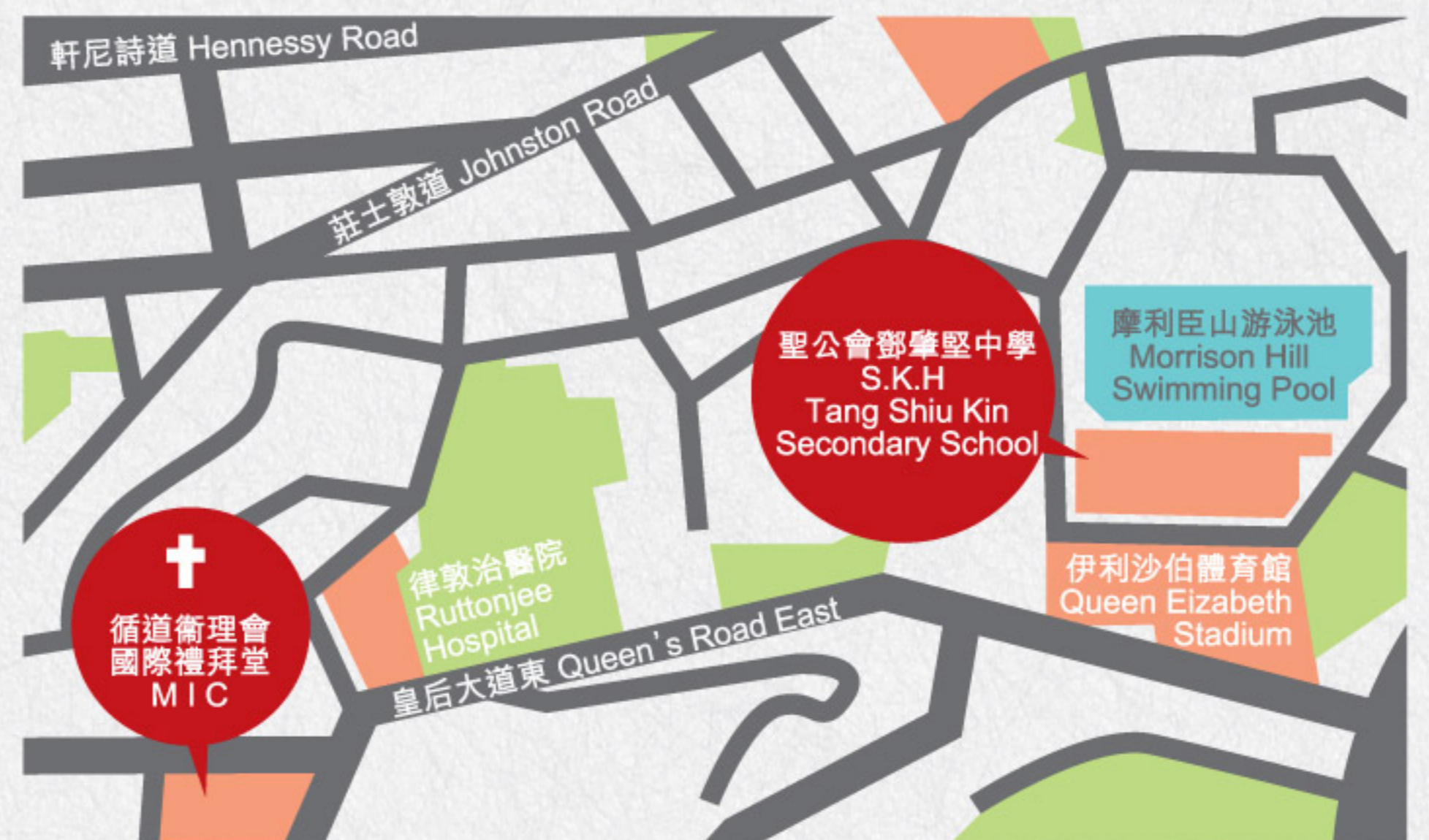
國際禮拜堂主日崇拜於灣仔愛群道聖公會鄧肇堅中學內舉行

這次回歸校園，是一個學習的旅程。作為基督的門徒，我們都是學生，永遠在不斷學習、不斷成長、反省、分享，並將我們所信上帝向教會所說的話，付諸實行。