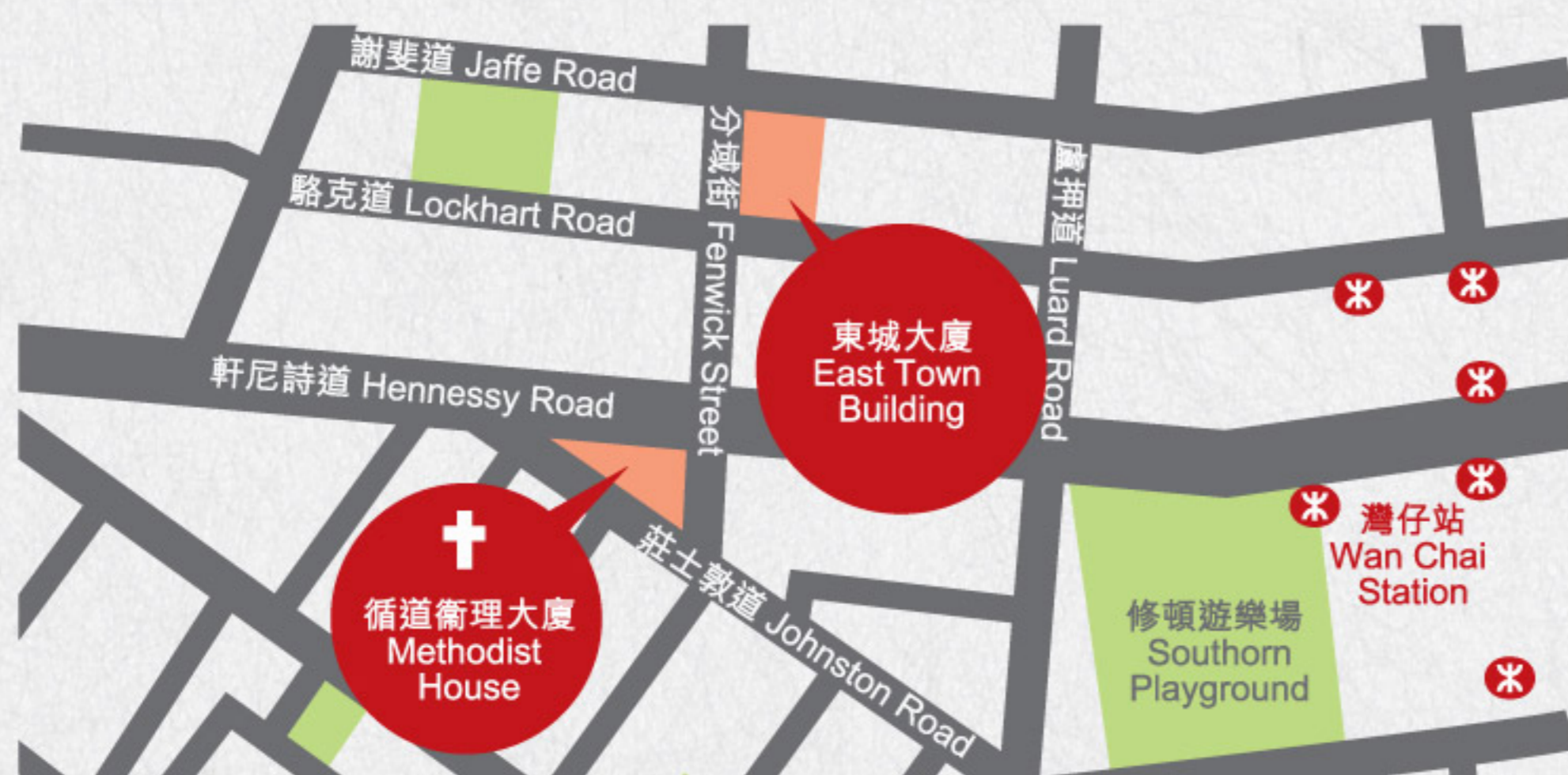
新辦公室：國際禮拜堂事工中心，灣仔駱克道41號東城大廈八樓，電話號碼、電郵地址及網址不變

在耶穌教訓人的寓言中，不乏一段段的旅程：牧羊人尋找迷失的羊；浪子回轉歸向父親的家；好撒瑪利亞人照顧被強盜襲擊躺在路邊的客旅。初期教會的信徒也踏上了朝聖之路，足跡遍佈世界各地，傳揚福音。同樣，從衛斯理約翰牧師騎在馬背上，走過千百哩路，宣揚福音，以至循道會的宣教士，遠渡重洋來到遙遠的彼岸，建立福音的群體，在在見證了循道衛理宗著重宣教旅程的特色。