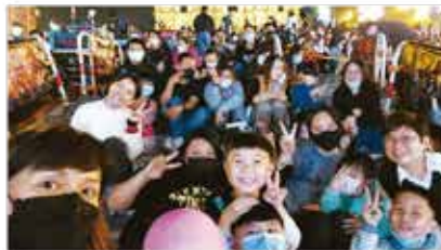
平安夜大三巴獻唱

2021年12月24日聯合澳門眾教會在大三巴一起佈佳音。這是全澳門基督教的盛事，已經舉辦廿九屆。當晚由八時開始直至午夜，聖誕歌聲響個不停，祝福坐在梯級上及路過的市民。