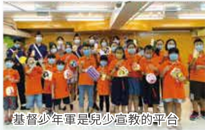
基督少年軍是兒少宣教的平台