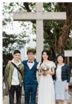
攝於女兒綺雯註冊日。

有時比較忙碌和疲累，但能為弟兄姊妹送上關懷與祝福，分享上帝的愛和恩典卻是好得無比。願主繼續使用我，能够事奉上帝，是我這一生最大的心願和福氣。