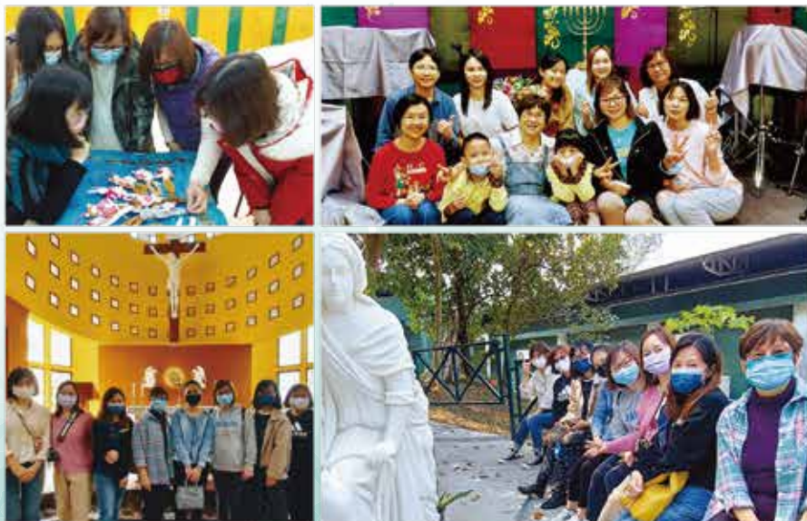
「起動」計劃姊妹，由手作到靈性之旅

「起動計劃」 計劃啟動於2021年初，旨在關心社區內生活有困難的家庭。透過恆常接觸，邀請婦女參加小組及孩童參加教會主日學或基督少年軍。經過超過一年的發展，計劃內容已轉型為團契支援小組，並發展出多元化活動，滿足參加者心靈所需。