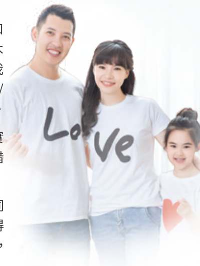
今天富仔有一個美滿家庭，卻沒忘這個成長的家，熱心事奉。