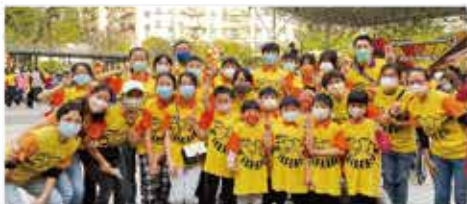
祝福澳門·社區服侍

「自律小先鋒」 透過建華中心宣傳和澳門堂的網絡，歡迎年輕家庭參加，並同時招募澳門堂青少年組成隊工，透過服侍，培訓成為小領袖。