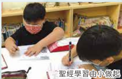
聖經學習由小做起