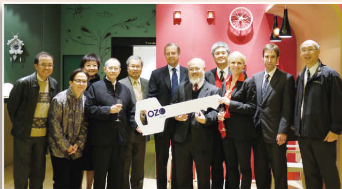
本會及 ONYX Hospitality Group 之代表合照。

本會與恒隆發展有限公司就營運衛蘭軒之二十年合約於二〇一二年一月卅一日屆滿，中午雙方代表見面，均為二十多年之愉快合作而感恩。同日傍晚，本會以簡單儀式將衛蘭軒未來二十年之營運權移交建基泰國 ONYX Hospitality Group 之代表。整幢物業現正進行大規模之裝修工程，預計本年年底以全新面貌之 OZO Wesley 投入服務，為客人提供可享受「酣睡美夢」之安樂窩。