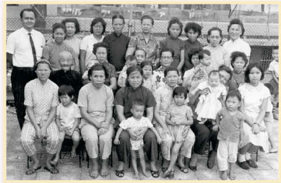
1965年信望堂舉行婦女聚會，左上為梁牧師。

1961 學成回港，先後調派到亞斯理牧區及李鄭屋邨堂（1965年命名為「信望堂」）擔任主任牧師。