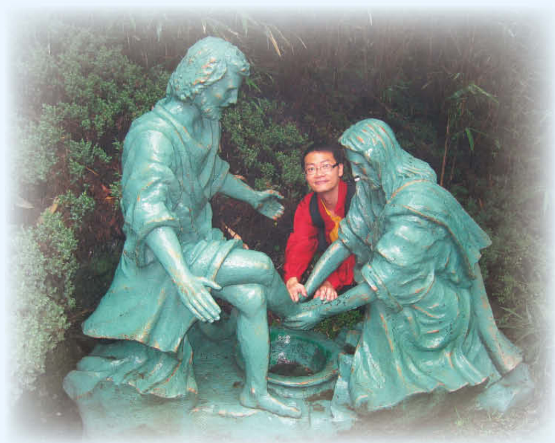
廣林堂祈禱山苦路十四站

我衷心感謝能探訪全世界最大的循道衛理會，有數萬會友的韓國循道衛理會廣林堂和他們在市郊所建立的祈禱山。（以下網址中有廣林堂的發展歷史及主日崇拜講道錄影 www.klmc.net/eng/ ）