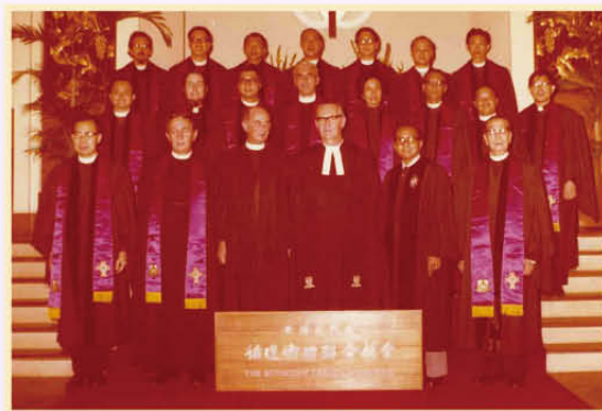
1975年「循道」「衛理」正式聯合，梁牧師（第二排左一）合照留念。

1972 當選為衛理公會會長，致力帶領循道公會與衛理公會在1975年正式聯合，其後又三度獲選為循道衛理聯合教會會長（1982-88及1994-97）。