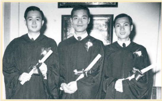
梁牧師（左一）畢業於新加坡三一神學院

1956 神學畢業後由衛理公會調派到北角衛理堂事奉，數月後因台灣衛理公會人手不足，便差派梁牧師到台灣教區任助理傳道，翌年重返北角衛理堂事奉。