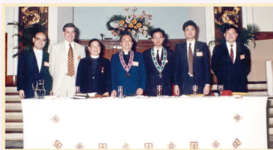
以會長身分主持本會代表部會議（中間者）