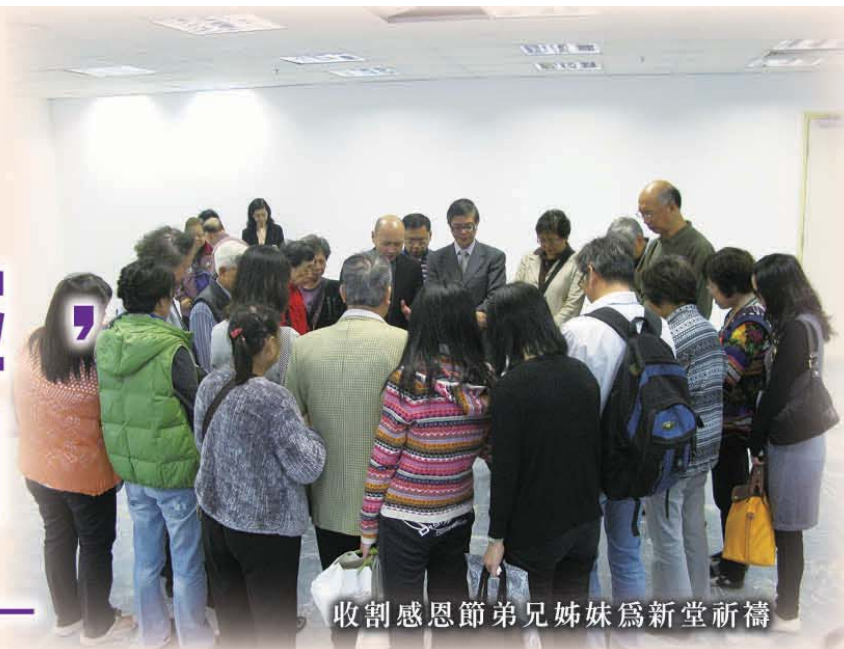
收割感恩節弟兄姊妹為新堂祈禱