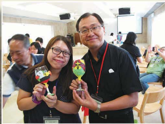
製造「模造我生命」之作品