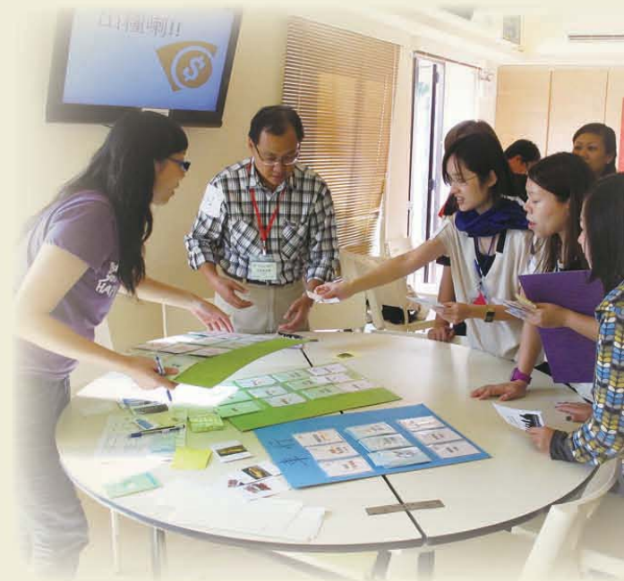
參與「一生何求？」之緊張情況