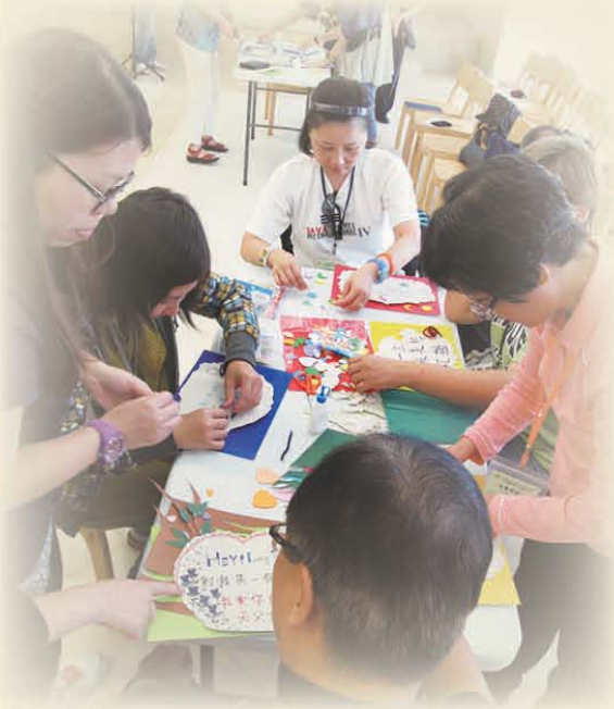
一同製作自己的墓誌銘

天災人禍、疾病禍患，使人感受到死亡的「近」與「實在」。對生命終結會感到惶恐與不安，是因人不知死後何往，更甚是以為死亡等於結束在世的所有。「生命探索系列——終極篇」，嘗試解釋死為何物，澄清錯誤的死亡觀，了解聖經對人生終極的言述。透過遊戲、講座、分享、電影及體驗，從多角度反思人生終極問題，期望讓信徒正視死亡問題，破解當中的迷思，做到一個助人自助的「生命大使」。以下為參加者之分享：