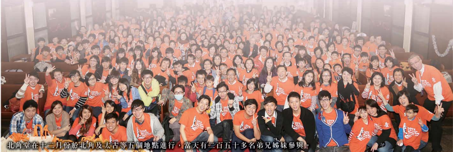
北角堂在十二月份於北角及太古等五個地點進行，當天有二百五十多名弟兄姊妹參與。

** 「讓愛走動全城 齊步祝福香港」大行動第二、三階段分別於2013年2-7月及8-12月舉行，盼望堂會積極參與及支持。如有任何查詢，歡迎聯絡本團同工（電話：6121 2783或電郵：admin@mem.hk）。