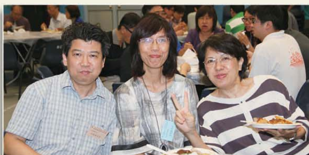
翌日會議之晚膳以自助餐形式進行，與會者均趁此良機與其他堂會之弟兄姊妹分享友誼團契。