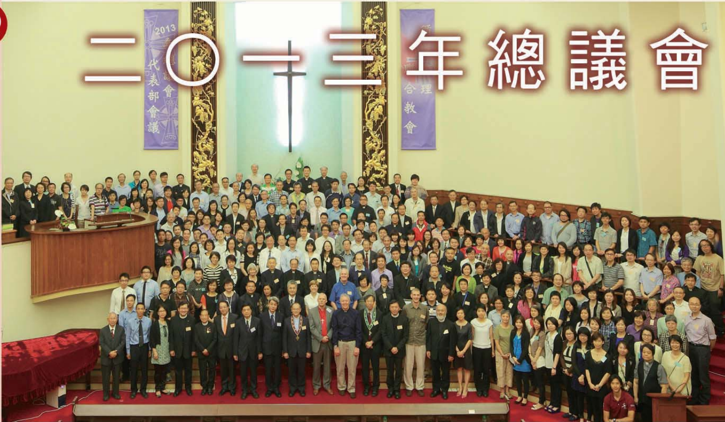
是次代表部會議在本會九龍堂舉行，出席、列席及旁聽者逾三百六十人，此為全體與會者合照。

本 會本年度之總議會代表部會議經於五月廿四及廿五日在本會九龍堂順利舉行，出席、列席及旁聽者逾三百六十人。