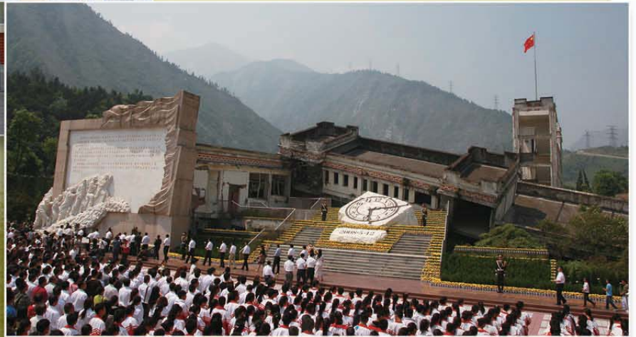
映秀鎮——汶川地震五週年紀念

行三人到達四川都江堰市，再次踏足此地，從前的板房區已拆掉了，每個重建的小區都煥然一新，沒有見到受地震損毀的建築物，只有一幢幢新蓋的樓房。華循中心遷徙到新安置區地下單位，繼續為街坊提供服務。