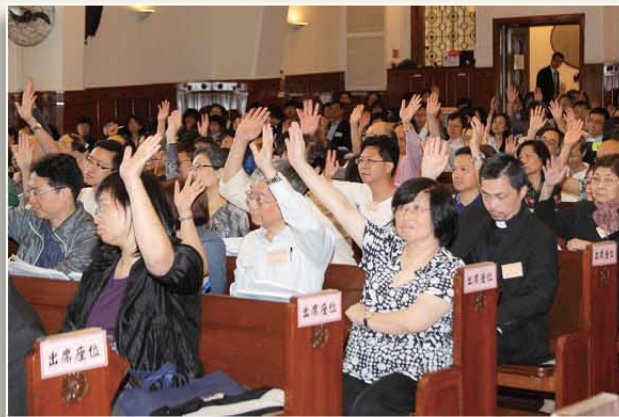
與會者踴躍舉手表示同意有關提案。