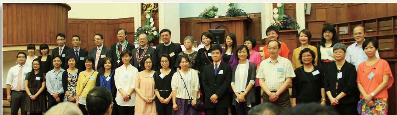
散會前，總議會辦事處同工與現任會長、副會長、總議會書記及司庫合照。

通過在本會總議會層面推動「基督裡的良伴」事工，請「基督裡的良伴專責小組」於八月完成試驗小組後提交具體之事工發展計劃；並增選信徒培訓委員會「發展策略小組」之成員，繼續探討信徒培訓部在培育信徒事工上之定位、角色，以及與堂會間之相互關係。