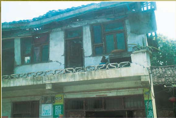
蘆山縣受地震影響的房屋

原定行程會在雅安市住宿一晚購買物資，但前一晚收到消息，當地七十二小時內會有大餘震，當地同工考慮到安全而取消行程，我們改往映秀鎮參觀，看看地震五年後的景況。我們參與了汶川地震五週年紀念活動，到公墓悼念，參觀紀念館，在館內令我對地震及重建有更多了解，還有展示五年前汶川大地震的影片，看到當時差不多整個地區夷為平地非常震撼，對於地震，我上了寶貴的一課，更讓我明白到我們要珍惜生命，積極傳福音的迫切，因為不知哪一天生命便到盡頭。