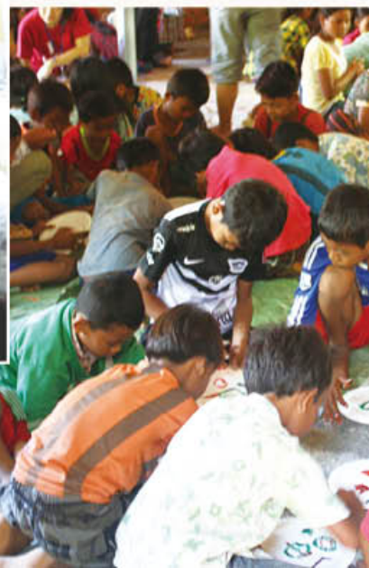
團員與小朋友一起 學習製作手工藝