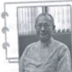
袁天佑牧師，香港基督教循道衛理聯合教會會長、香港基督教循道衛理聯合教會香港堂主任、香港基督教協會主席。