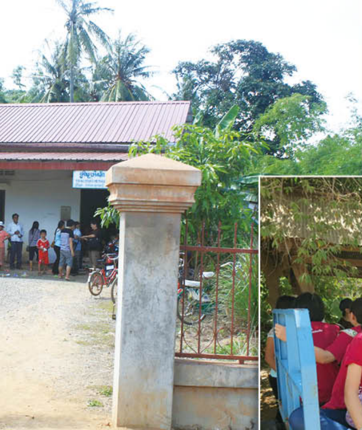
乘搭「牛車」前往 Boegetrors Methodist Church