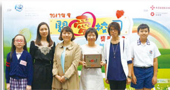
大埔循道衛理小學於2014年榮獲「卓越關愛校園之最積極推動生命教育」主題大獎，校長（右三）、老師及學生一同領獎。