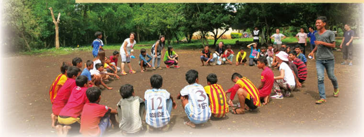
帶領 Touk Thlar Methodist Church 年輕人參與破冰活動

走訪離金邊七個小時車程的偏遠鄉村教會，主要服侍村內的孩童及少年人。每到之處，他們早已聚集等候，甚至列隊歡迎。無論唱歌、遊戲或話劇，他們都十分投入，渴望被探訪、被關懷。而其中一間教會還表示，這年來我們是第一個探訪他們的團體。一個曾經被自己同胞用殘酷、冷血殺戮，三百萬人民枉死的國家，三十多年後仍然是無規劃、發展停頓、貪污嚴重的地方。這地方，似乎被人遺忘及離棄了！但上帝從沒忘記及捨棄，祂差遣不同的天使，將愛帶給這地方。你是否也願意成為一位被上帝差遣的天使，把愛和關心送出？