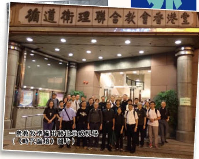
一眾教牧準備出發往示威現場

我看到這訊息後不期然感到心情忐忑，不是因為我當時正忙於預備主日堂慶聯合崇拜的講章，而是要考慮參加一個可能會有警民衝突、身體受傷的行動。坦白說，我從未有這類行動的經驗，那一刻又不知可找誰人詢問意見。我知道不單是我，其他牧師也可能面對相同的抉擇；但我當想到會長及其他牧師都義無反顧的上「前線」時，試問我又怎能獨自安坐家中，更怕他日會因為自己缺席而後悔不已，於是毅然起來換上牧師衫。在換衫過程中和家人交代緣由，他們都沒有太大的反對，自己卻感受到家人的憂慮。在前往的途中，我通知了一位同工，請弟兄姊妹為牧師們祈禱守望，並囑咐不用前來參與；這同工表示若年青信徒知道我們這行動，恐怕難阻不了他們到來。後來再得到這位同工的通知，他得到太太同意可以到香港堂協助，惟答允不會到特首辦集會。往後的時間，牧師團隊收到很多弟兄姊妹發到手機的訊息，表示欣賞我們的行動，同時又表達出極為擔心我們的安全。