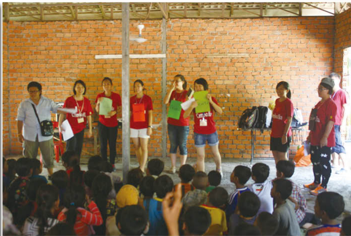
團員在「紅磚教會」 Tea Lom Methodist Church 演出福音話劇