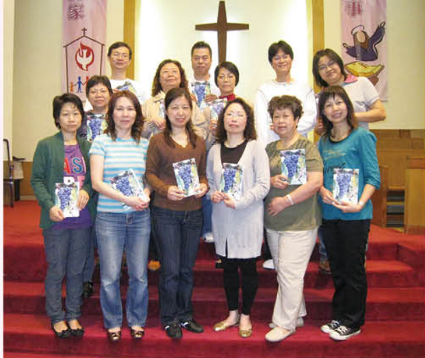
活出豐盛生命畢業加許禮