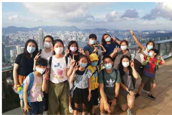
師友計劃能協助小朋友開拓視野，為未來奠下重要的基礎。

貧窮與社會環境及制度環環緊扣，要解開這個枷鎖實不容易。但願我們堅守信念，以上帝的愛為每一個貧窮家庭送上祝福，正如耶穌說：「我實在告訴你們，這些事你們做在我弟兄中一個最小的身上，就是做在我身上了。」（太廿五:40）