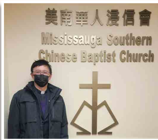
到不同教會講道，分享奮進接待的信息。

現時正式接觸「移加有朋友」的香港家庭已達到四百四十多個，還未計在日常非正式渠道而提供協助的朋友。在香港二〇一九年發生巨大轉變後，決心流散到海外的香港人愈來愈多，除了選擇最熱門前往的英國之外，加拿大政府所提供的「救生艇計劃」，使無數的香港人選擇加拿大成為他們最終的目的地，這還沒有計算本身已經擁有加拿大國籍的十萬在港的加拿大人。如果將來他們不能擁有雙重國籍，又或他們失去留港居住的信心，就會選擇回流加國，那麼教會必須好好準備牧養他們。或許，香港人從來都沒有想過會成為流散者（Diaspora），但既然時代選中了我們，香港及海外教會就必須負上牧養和接待他們的責任。