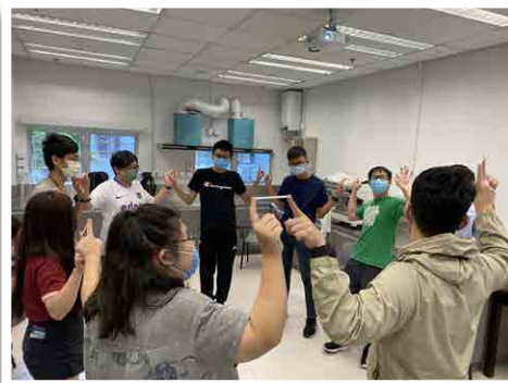
職前培訓及自我認識

對SEN畢業生而言，離開教育系統後往往缺乏支援，尋求僱主的支持實在不容易，故他們對自己的前途感到迷惘及徬徨。此計劃正正能夠填補有關服務之不足，讓畢業生在開放及共融的氛圍下，把握裝備自己的實戰機會；計劃亦令他們開啓自己的職業路向，締造多贏的局面。🎯