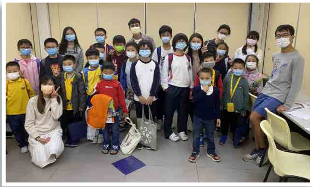
功課輔導班能協助化解家長與小朋友之間的矛盾

新 冠肺炎疫情於二〇二〇年年初爆發時，相信無人能夠想像疫情持續接近兩年仍未見盡頭。大家由一開始感覺恐懼，到努力適應，及至今天思考與病毒共存，每一步都走來不易。疫情令經濟停擺，學校亦曾停課，基層家庭成為首當其衝的一群，他們面對的困難包括：因失業及開工不足，導致經濟拮据；學童因缺乏上網設備，加上網上課程趕急，令他們的學習進度遠遠落後。一場疫情亦令許多家庭陷入危機之中，小朋友失去兩年的童年時光，每天只能坐在家中，令他們的社交及學習能力倒退，家長實在擔心不已。作為以服務基層為本的團隊，同工每時每刻都思考如何支援有需要的家庭及再次喚起兒童對快樂生活的期待。以下是服務處的個案分享：