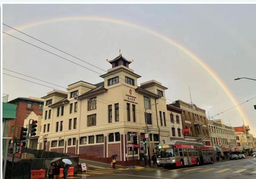
三藩市唐人埠的衛理公會華人美以美會

總的來說，海外牧會和在港牧會差不多，教會路線發展圖並不是最重要。最重要的，就是要看看那牧者，是否有使命感的牧人心腸。🇺🇸