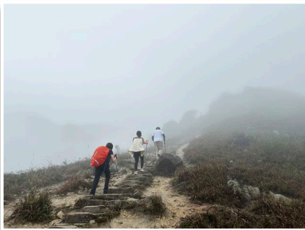
走上高山的隱密處

在全港第三高的山峰——大東山上，有十九間石屋組成的建築群，被稱為「爛頭營」（Lantau Mountain Camp），是由不同國籍、不同差會、不同宗派來華的宣教士，在約一百年前先後搭建而成的避暑退修場地。本宗原有數間小屋，但多年以來已把部分轉讓，至今只保留了一間「8號營舍」，印記着本宗來華宣教歷史的一頁。