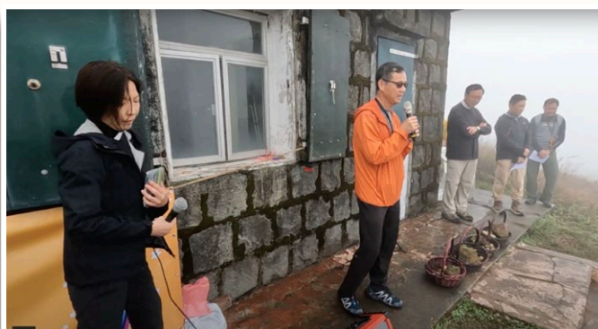
立石為記，毋忘主恩。