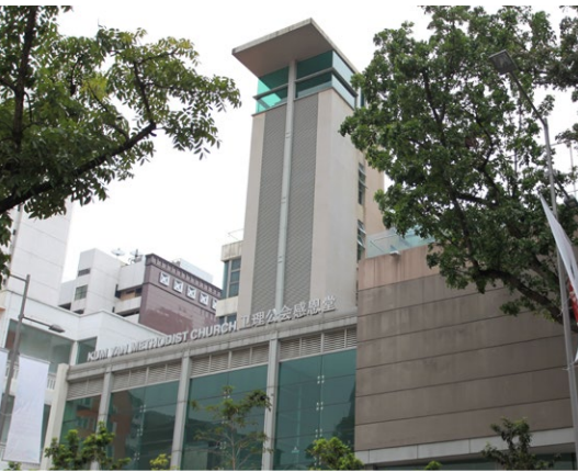
新加坡衛理公會感恩堂

新加坡是個多元種族的國家，新加坡衛理公會也分為以華人方言為主的華人年議會、以英語為主的三一年議會，以及以南印度語為主的以馬內利淡米爾年議會。三個年議會共有四十六所教會、十五所學校和多所宣教和社區服務處，會眾超過四萬四千人，是新加坡最大的基督教宗派。