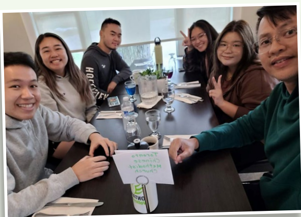
周牧師（右一）與青年教友

教會是以關係佈道的模式作為福音工作的核心，即是朋友帶朋友，雖然果效慢一點，但主自有祂的時間。在剛剛過去的一年，很多香港的職青、年輕家庭及一些中學生移居加拿大，使中學生團契人數得着倍數的加增。當然，香港來的年輕人與加拿大本地的年輕人真的不一樣，因為人手的關係，教會不能成立廣東話中學生團契，所以要融合背景各異的年輕人。感謝主，「在人這是不能，在上帝凡事都能。」（太十九：26）經過一番掙扎、彼此包容的過程，最後這兩群處境及成長經歷有很大差別的青少年，都能在同一個團契中學習相交相愛。🇨🇦