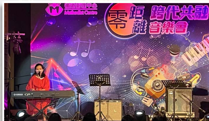
邀得視障女高音藝術家蕭凱恩小姐演唱